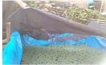
Gambar 4. Proses Formulasi Produk

Formulasi yang digunakan pada produk Pawang Bu Eko ini menyesuaikan dengan referensi data mengenai presentase kebutuhan gizi pada ternak unggas yaitu : dedak tidak boleh lebih dari 20%, (serat), daun azolla microphylla, ampas tahu, kulit kedelai 60% (protein dan lemak), nasi aking 20% (karbohidrat) (scoot et al;2015)