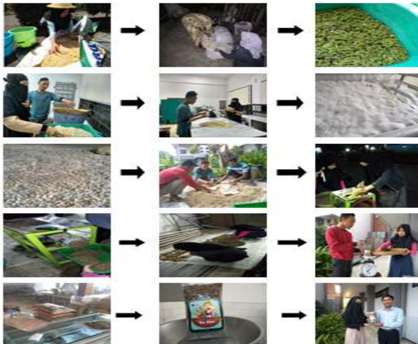
Gambar 5. Proses Produksi dan Penjualan Pawang Bu Eko

PAWANG BU EKO (Pakan Ternak Bikin Kenyang, Berkualitas dan Ekonomis)