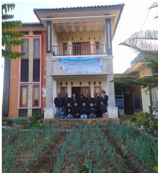
Gambar 4. Lokasi KPM di Batik Kalosa