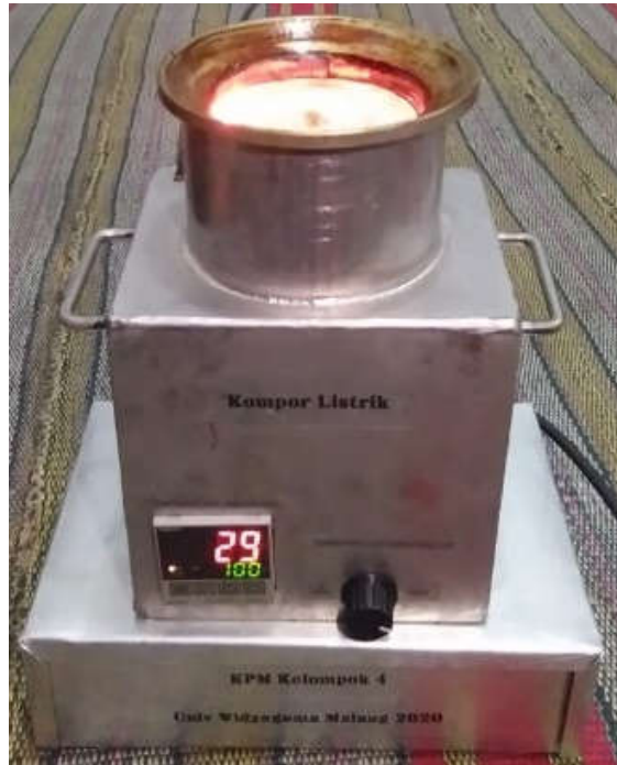
Gambar 5. Bentuk Kampor Listrik Hasil KPM Kelompok 4

Jika diasumsikan menggunakan minyak tanah perbulannya akan mengeluarkan uang sejumlah Rp. 1.080.000 dan apabila menggunakan kompor listrik akan mengeluarkan uang sejumlah Rp 42.900.