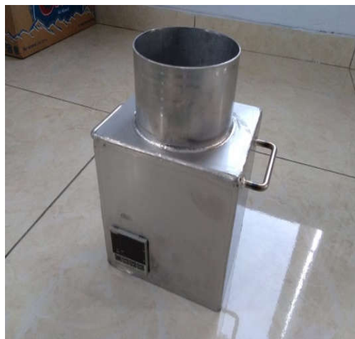
Gambar 3. Purwarupa Kompor Listrik