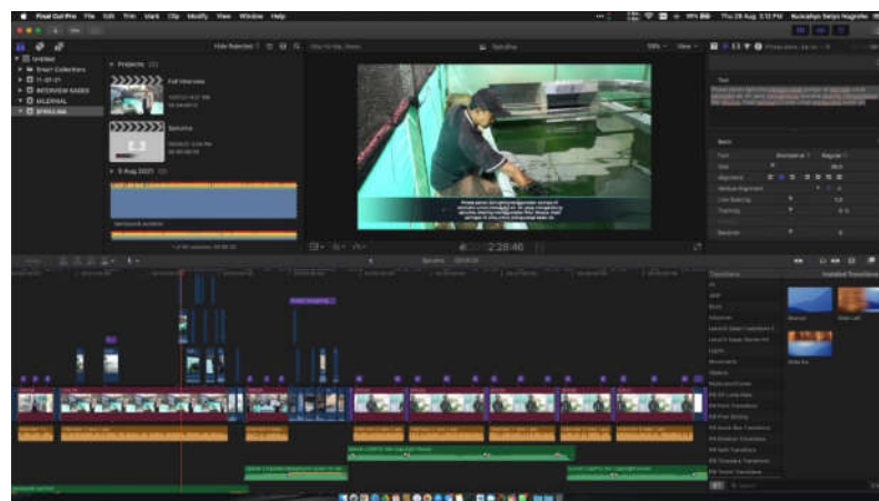
Gambar 2. Proses Editing Video

Tim videografer kemudian memberikan preview video kepada Tim pengabdian dan Mitra untuk dilakukan evaluasi dan saran mengenai bagian-bagian video yang perlu