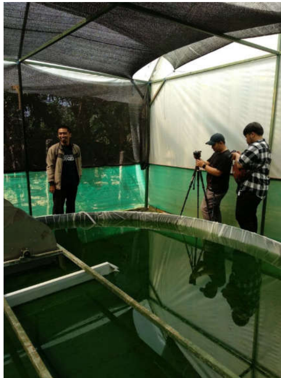
Gambar 1. Proses Pengambilan Video

Tim videografer kemudian melakukan pengambilan gambar di kediaman mitra. Hal ini dilakukan agar dapat menentukan angle pengambilan video yang baik, serta untuk mengetahui spot unik yang dapat dimasukkan ke dalam video profil seperti pada Gambar 1. Proses pengambilan video dilakukan di kediaman mitra. Tidak terdapat kendala signifikan selama proses pengambilan video. Tim videografer dapat menggunakan peralatan pengambilan video seperti tripod, kamera dan microphone dengan baik. Setelah proses pengambilan video selesai, tim videografer melakukan proses editing video menggunakan software editing video seperti pada Gambar 2.