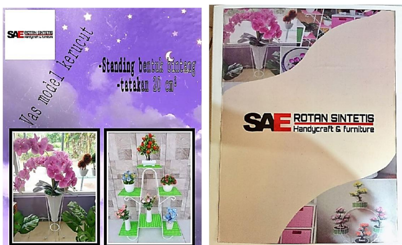
Gambar 3. Katalog Produk Sae Rotan

Dengan adanya katalog produk, pelanggan akan lebih mudah menentukan produk apa saja yang tersedia beserta ukuran produk dan pilihan warnanya. Katalog biasanya berisi gambar atau foto hasil produk, informasi ukuran, dan pilihan warna yang disediakan seperti pada Gambar 3. Membantu pelanggan dan calon konsumen Sae Rotan untuk mengetahui hasil produk dan memilih produk mana dan warna apa yang mereka sukai.