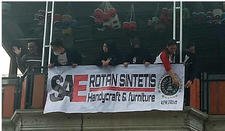
Gambar 1. Papan Nama Sae Rotan

Memiliki papan nama atau tanda lokasi seperti pada Gambar 1 sangat penting untuk dimiliki oleh pemilik usaha agar memudahkan konsumen yang datang langsung ke lokasi, terutama konsumen baru yang pertamakali datang ke lokasi. Semenjak adanya pandemi, pesanan produk Sae Rotan sempat mengalami penurunan, dengan adanya promosi secara online diharapkan dapat membantu Sae Rotan untuk memperluas pasar sehingga pesanan produk Sae Rotan dapat meningkat kembali. Agar calon konsumen lebih mudah menemukan lokasi Sae Rotan, terutama bagi calon konsumen yang baru pertamakali datang ke sana. Selain mencetak banner, membantu promosi secara online agar lebih membantu mengenalkan produk Sae Rotan kepada pengguna internet. Masyarakat sekitar dan calon konsumen agar lebih mudah mengetahui produk apa saja yang disediakan di Sae Rotan dan juga memudahkan mereka untuk menemukan lokasi Sae Rotan.